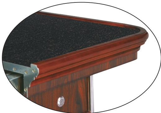
仿大理石黑金沙防火面板