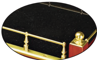
黑金沙大理石面板