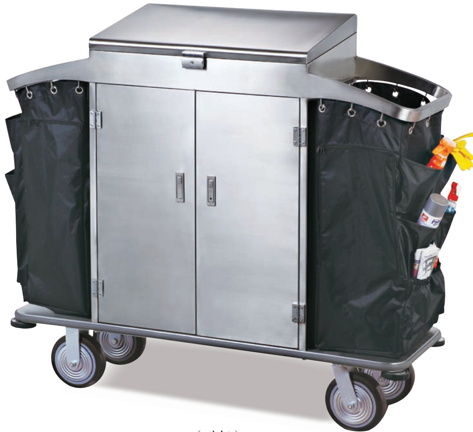
C-38B ( 砂钢 )