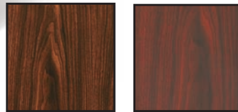
胡桃木防火板 红桃木防火板